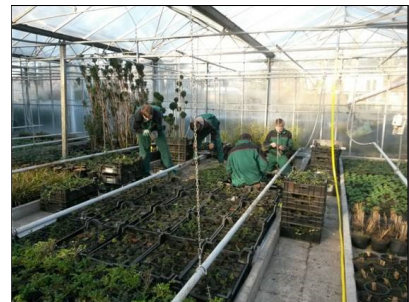
GROENVOORZIENING en -DECORATIE